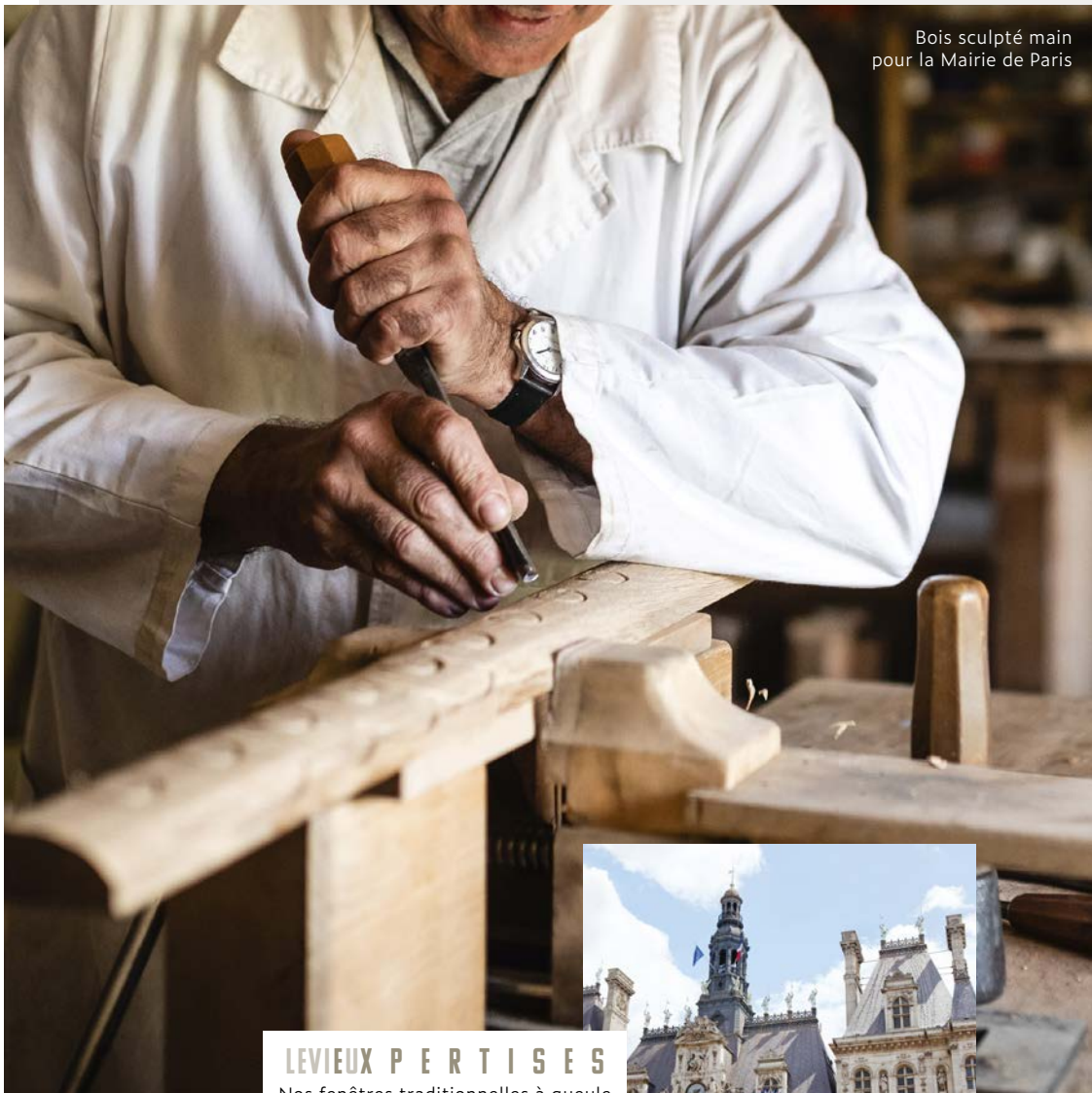
Bois sculpté main pour la Mairie de Paris