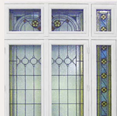
Repose de vitraux anciens