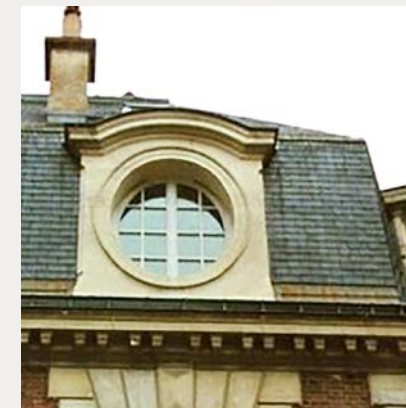
Œil de Bœuf