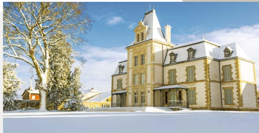
Adaptation aux styles et attentes de vos projets